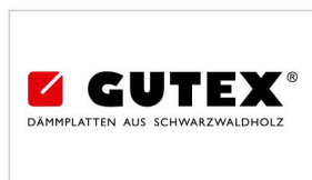
GUTEX Holzfaserplattenwerk www.gutex.de