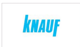
KNAUF Gips KG www.knauf.de