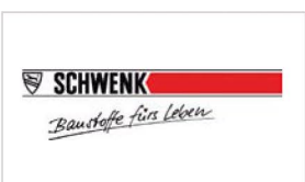
SCHWENK Putztechnik AG www.schwenk-putztechnik.ch