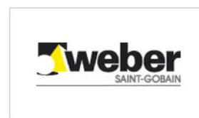
Saint-Gobain Weber GmbH www.sg-weber.de