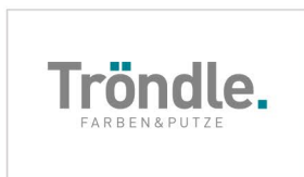
Tröndle Edelputz GmbH www.troendleputz.de