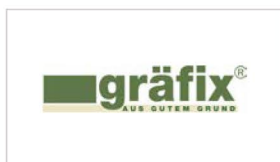
Wolfgang Endress Kalk- und Schotterwerk GmbH & Co. KG www.graefix.de