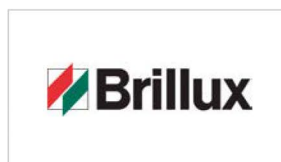
Brillux GmbH & Co. KG www.brillux.de