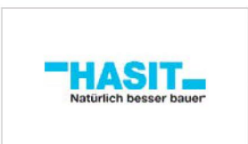
HASIT Trockenmörtel GmbH www.hasit.de